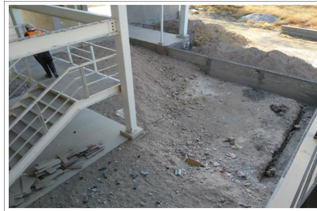
F5: Vista al interior