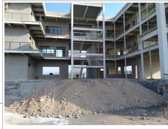
F3: Vista posterior

Se realizó excavación en zanja de 0.60x0.60 en una longitud de 170 mts. lineales para la instalación de tubería de 10" para conectar hacia pozo de visita, se hizo una cama de arena y se relleno con tepetate compactado por medios mecánicos (bailarina), se cubrió parte de tubo con concreto ciclópeo, se construyeron 3 pozos de visita. En el patio hizo guarnición y se colaron firmes de concreto como indica el proyecto.