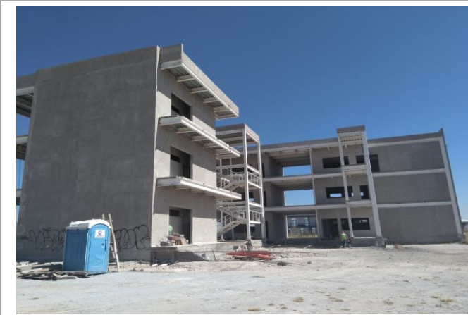
F2: Vista lateral Izquierda