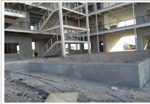
F4: Vista lateral Derecha