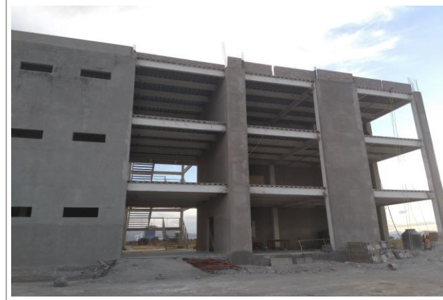
F1: Vista principal